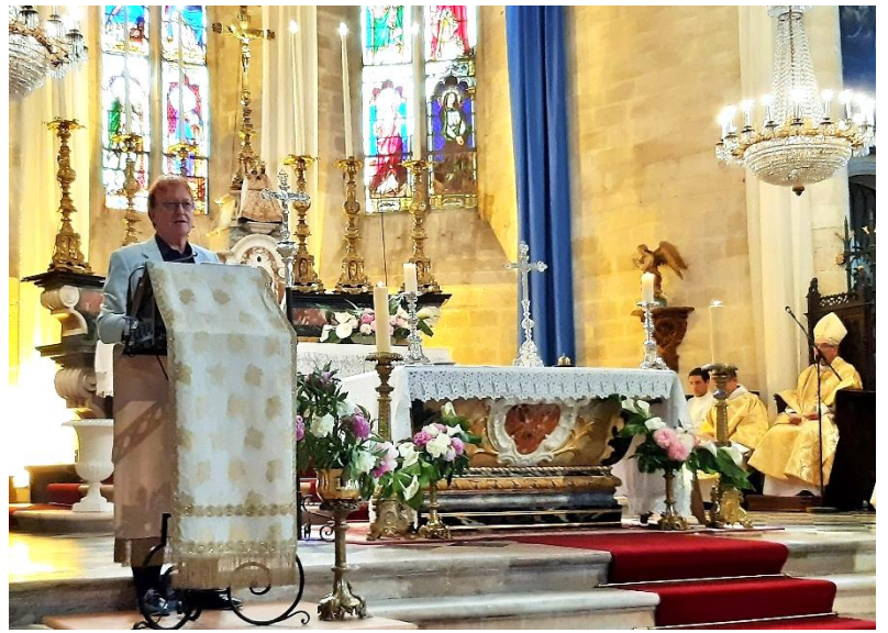
Les lecteurs et Les animateurs chants et musiciens sans oublier les organistes